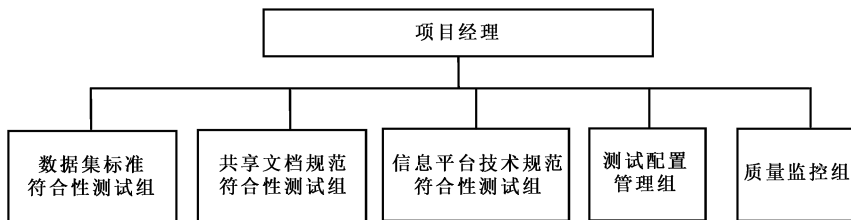
图 2 测试组织结构图

电子健康档案与区域卫生信息平台标准符合性测试采用项目经理负责制，负责整个测试工作的进度控制、质量控制以及协调、沟通等。